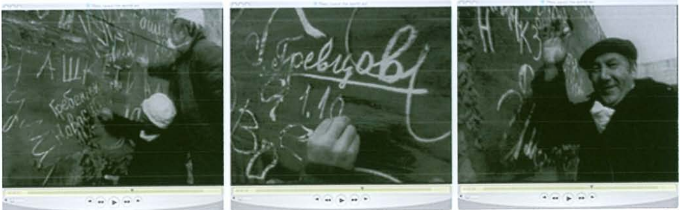
Images du film : Fin de la construction du sarcophage. Les derniers ouvriers le signent à la craie.

Montage et compléments : Yves Lenoir / Réalisation des sous-titres : Michel Hugot