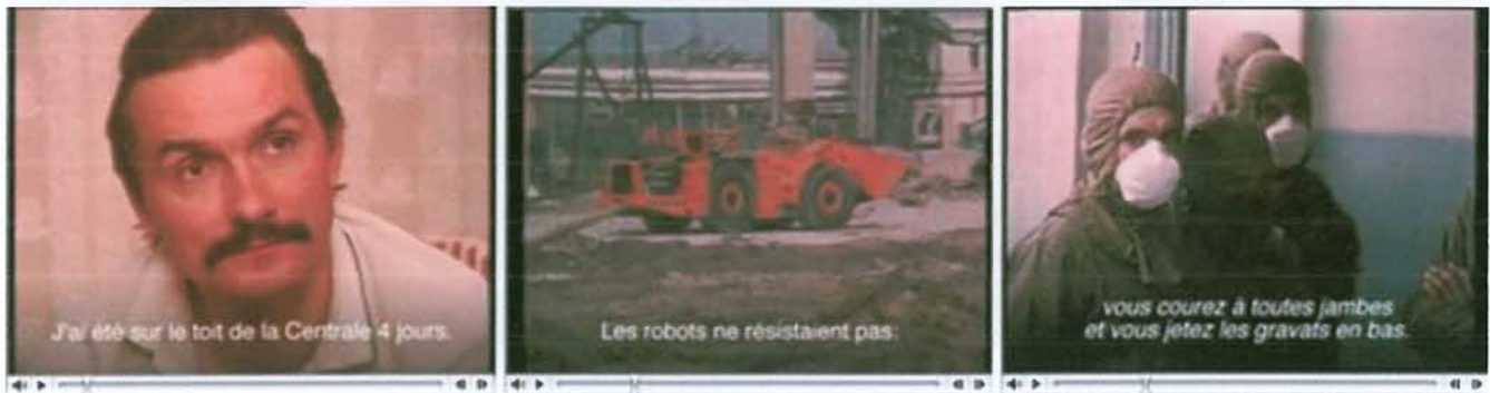
Images du film