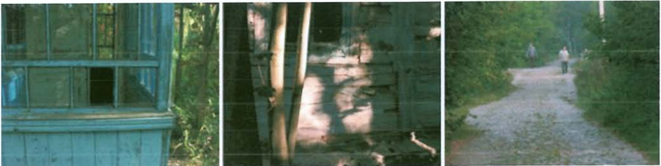
Village de Tchernobyl - Ukraine –

Une centaine d'images et un texte mélangeant les genres littéraires (Documentaire / Journalistique / Philosophique / Fiction / Poésie) racontent l'histoire de Tchernobyl. Une approche poétique visant à casser le barrage anxiogène qui entoure le sujet, à le mettre à la portée de tous.