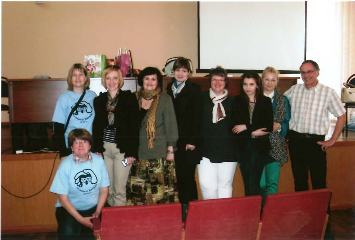
La délégation de l'association en compagnie des 5 interprètes russes

La seule guerre déclarée visible, les seuls hommes que j'ai vus se battre, c'est pour aider les enfants qui continuent d'habiter sur des territoires contaminés par les retombées radioactives de Tchernobyl : la radioactivité n'a pas de frontières.