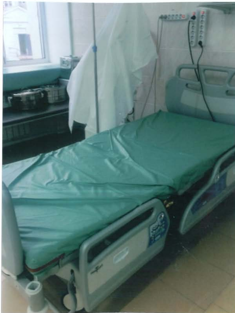
Le lit offert grâce à votre générosité

L'essentiel étant qu'aujourd'hui les patients disposent de 3 lits dignes de ce nom contre 0 il y a moins d'un an !