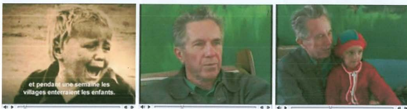
Images du film