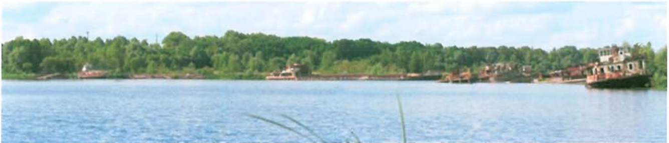
Port de Tchernobyl. Abandonné. Interdit. Village de Tchernobyl - Ukraine –

C'est dans ce contexte qu'est née l'idée de transformer mon carnet de voyage en une œuvre collective associant d'autres personnes, et d'en faire un ouvrage participatif. " TCHERNOBYL FOREVER " sera un livre-dvd et servira d' " appel " pour une campagne humanitaire au profit des enfants exposés aux radiations et abandonnés à leur triste sort en Belarus. Si ce livre se fait pour créer des ressources sur le terrain, alors notre travail prendra vraiment tout son sens. J'ai proposé l'idée à l'association " Enfants de Tchernobyl Belarus ", et nous avons commencé à bâtir l'opération. Aujourd'hui elle est prête. Reste à la réaliser. Le succès de l'opération est dans les mains de tous."