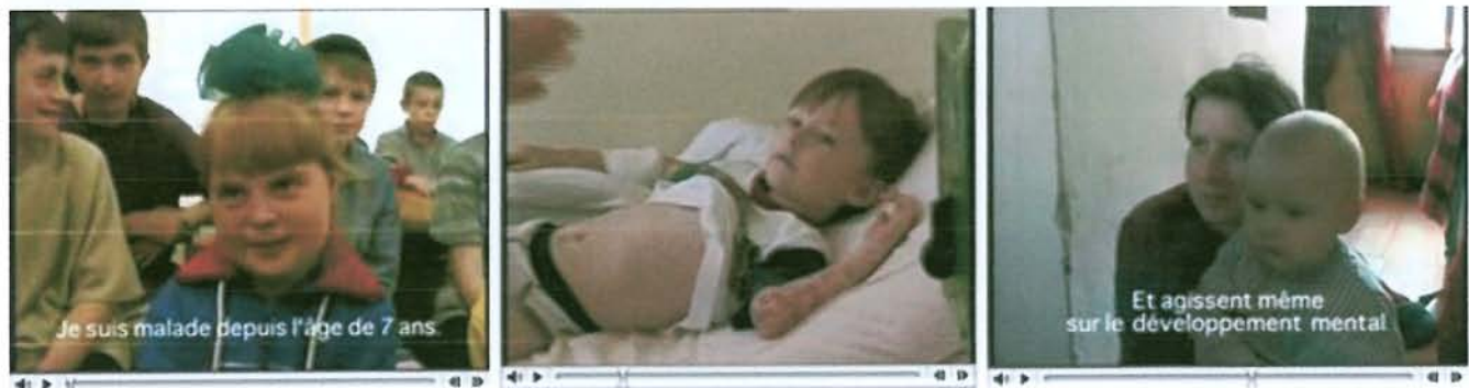
Images du film