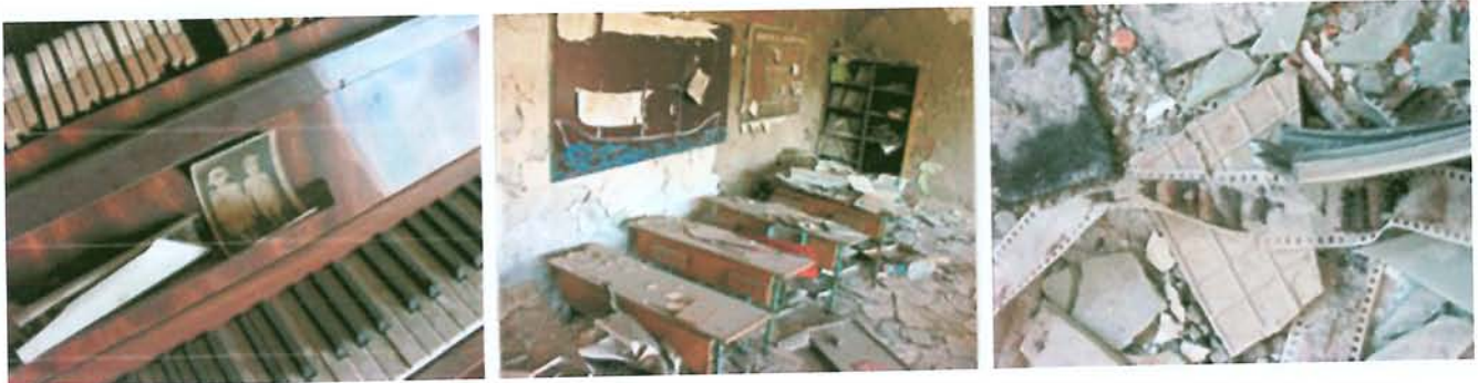
Pripiat - Ukraine - Piano abandonné / École élémentaire / Cinémathèque

Tous ceux qui sont allés à Tchernobyl de leur propre gré, avec le désir de savoir et de témoigner au travers de leurs spécialités sur cette crise atomique majeure, vous diront qu'il est un devoir de témoigner de ce qu'ils ont découvert. C'est le cas des auteurs qui participent à l'ouvrage collectif "TCHERNOBYL FOREVER". Ce sont des « passeurs de vérités interdites », et, bien sûr, des insoumis au lobby nucléaire. Il faut déchirer le mur du silence et casser la chaîne criminelle du mensonge des agences de l'ONU et des mensonges d'États, mis en place immédiatement après la catastrophe. Le sujet est anxiogène et le lobby atomique très influent, ce n'est pas chose facile. Il faut dénoncer cette poignée d'irresponsables criminels et tous ceux qui voudraient aujourd'hui nous faire croire que l'atome transforme en paradis les zones qu'il contamine, et que ce « Laboratoire de l'enfer » délimité après la catastrophe est en fait devenu un nouveau jardin d'Éden. La réalité est bien moins idyllique : jusque très loin de la centrale, 500.000 enfants sont exposés aux retombées radioactives de Tchernobyl sans bénéficier d'aucune mesure de radio-protection de la part des autorités nationales et internationales. Source: BELRAD.