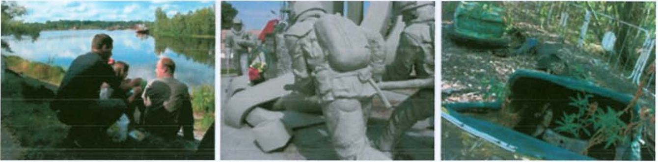
Village de Tchernobyl - Déjeuner sur l'herbe / Monument aux pompiers / Parc d'attractions Pripiat

C'est dans ce contexte qu'est née l'idée de transformer mon carnet de voyage en une œuvre collective associant d'autres personnes, et d'en faire un ouvrage participatif. " TCHERNOBYL FOREVER " sera un livre-dvd et servira d' " appel " pour une campagne humanitaire au profit des enfants exposés aux radiations et abandonnés à leur triste sort en Belarus. Si ce livre se fait pour créer des ressources sur le terrain, alors notre travail prendra vraiment tout son sens. J'ai proposé l'idée à l'association " Enfants de Tchernobyl Belarus ", et nous avons commencé à bâtir l'opération. Aujourd'hui elle est prête. Reste à la réaliser. Le succès de l'opération est dans les mains de tous."