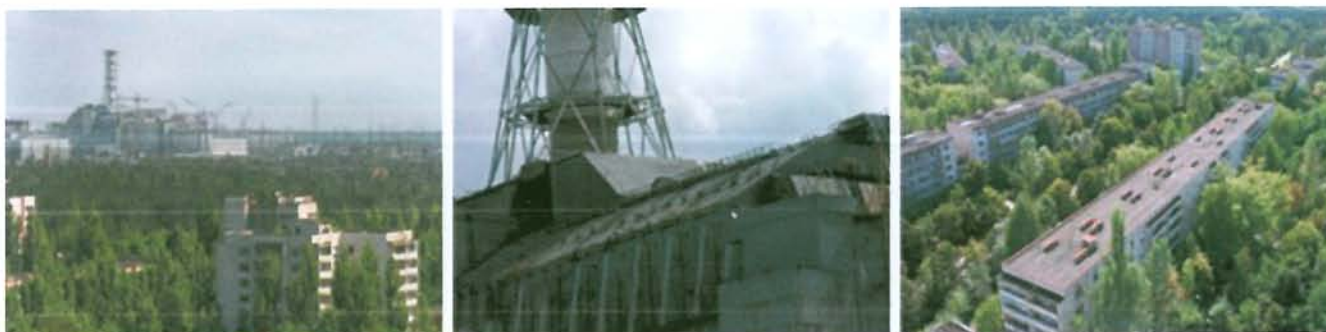
Pripiat - Ukraine - La centrale à 1,8 km, de la ville / Le sarcophage / " Le domaine des dieux de l'atome "

Les fonds collectés maintenant permettront d'éditer 3.000 livres-DVD et 2.000 DVD de TCHERNOBYL FOREVER (Traduit en 7 langues : Français / Anglais / Allemand / Espagnol / Italien / Norvégien / Japonais). Cet ouvrage collectif sera ensuite donné par l'association " PHOTOGRAPHISME " (Maître d'œuvre de l'ouvrage collectif) à l'association " ENFANTS DE TCHERNOBYL BELARUS " (ETB) qui s'occupe de l'organisation et de la gestion de l'OPÉRATION HUMANITAIRE INTERNATIONALE " TCHERNOBYL FOREVER ".