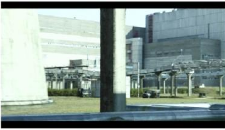
Les abords d'un réacteur de la centrale-décor dans CHERNOBYL.