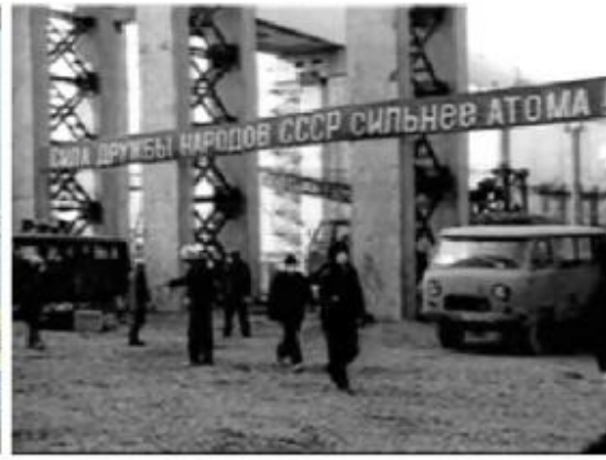
Les abords du Bloc 4 de Tchernobyl en août 1986

Texte de la banderole : « La vigueur de l'amitié entre les Peuples de l'URSS est plus forte que l'Atome »