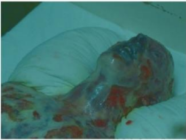
L'acteur grimé dans le rôle d'ignatenko