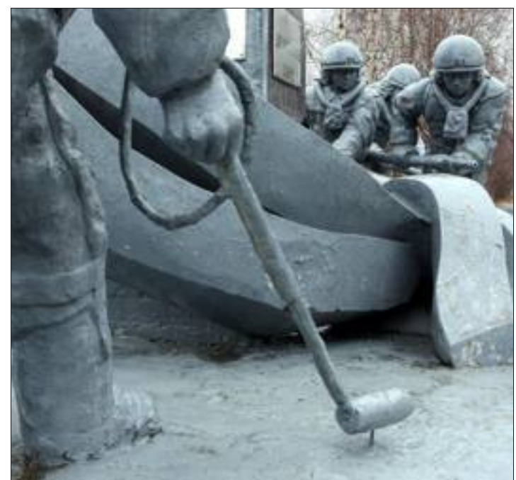
Devant la caserne des pompiers de Tchernobyl, le monument à la mémoire des pompiers, premières victimes de la catastrophe.