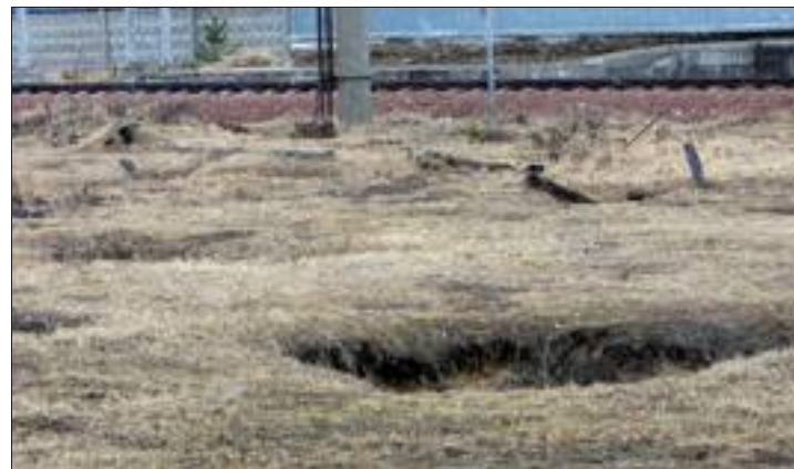
Derrière le parking visiteurs, une des 800 fosses de déchets irradiés. Elle s'effondre, des matériaux radioactifs remontent à la surface.