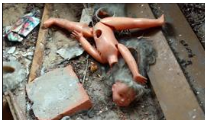
Dans une maison évacuée de la zone d'exclusion de Tchernobyl, une poupée d'enfant, symbole de vies brisées.