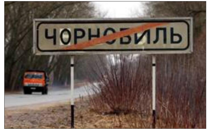
La cité de Tchernobyl: des salariés de la centrale y sont logés.