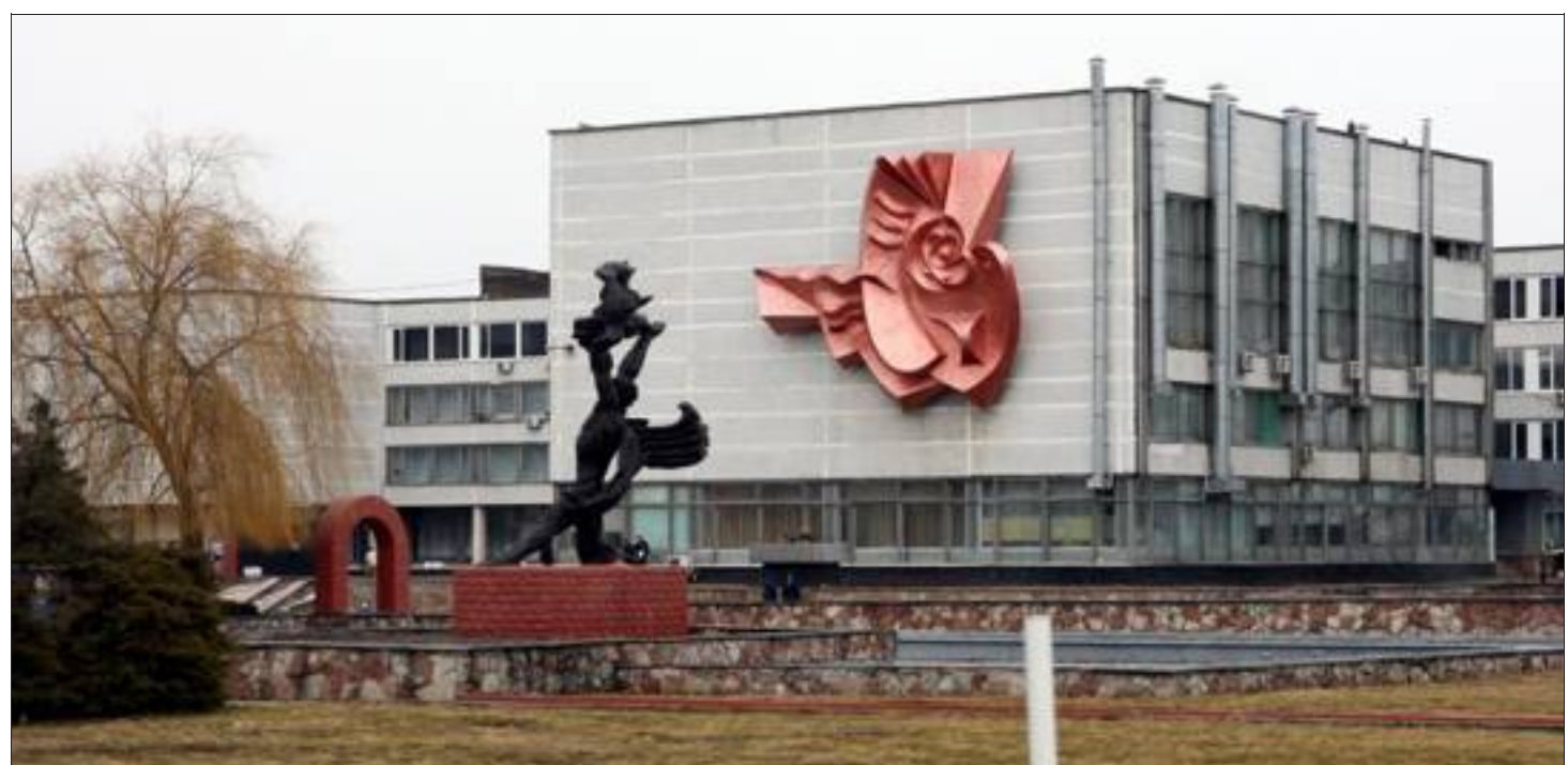
La statue de Prométhée trône dans le jardin du souvenir devant l'entrée de la centrale nucléaire de Tchernobyl.