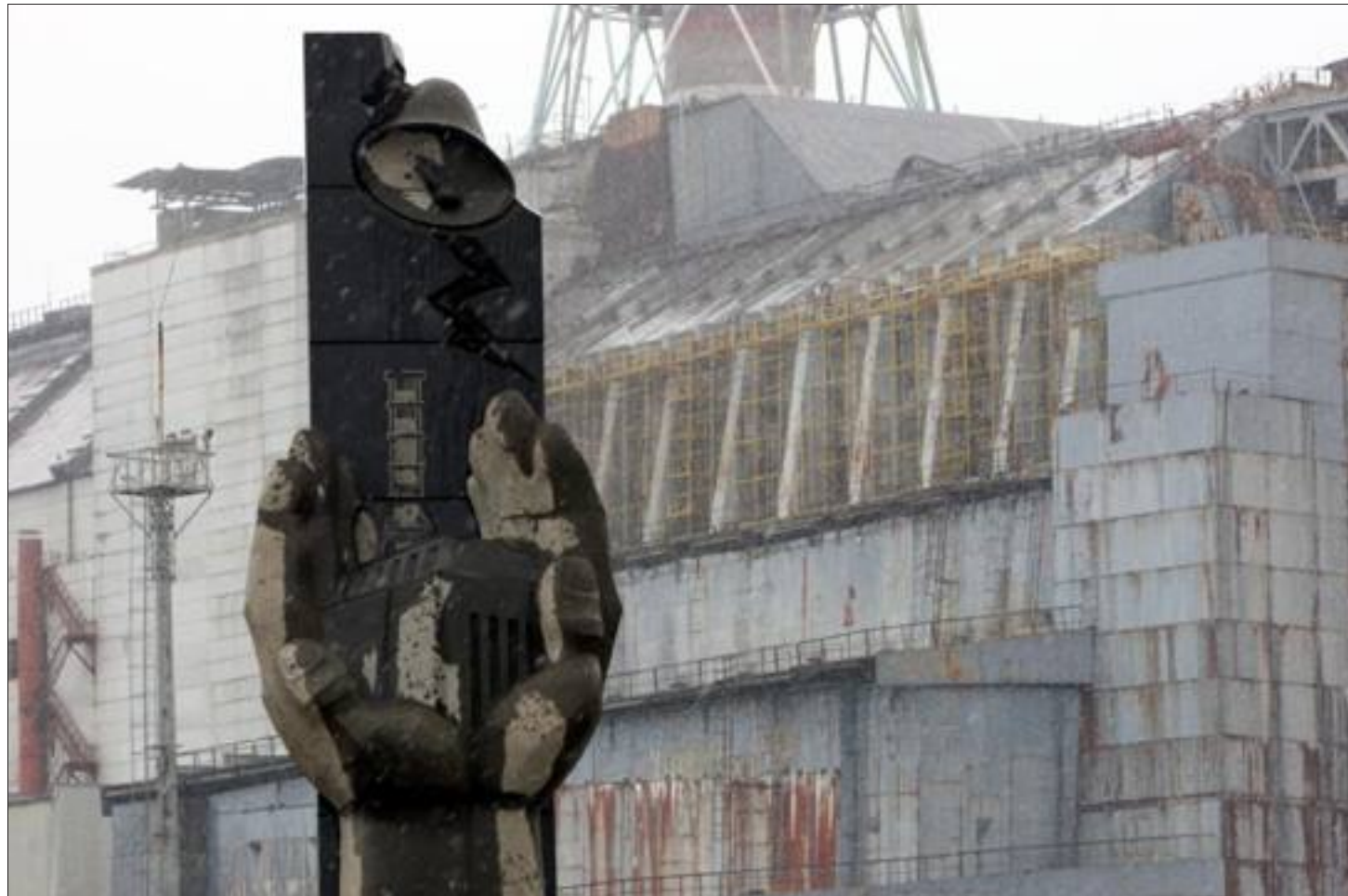
Devant le sarcophage du réacteur n° 4 de la centrale de Tchernobyl, une stèle à la mémoire des liquidateurs.