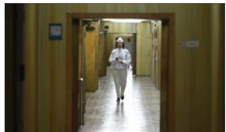
3 200 personnes travaillent encore dans la centrale de Tchernobyl. Les salles de contrôle des réacteurs sont reliées par le « couloir d'or ».