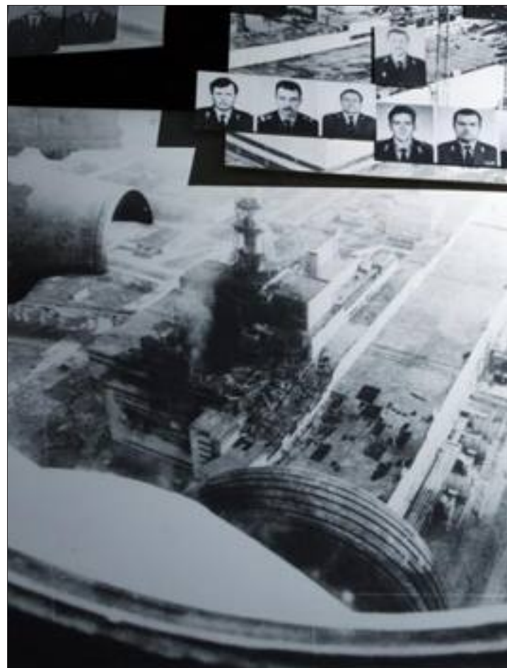
Vue aérienne du réacteur n° 4 de Tchernobyl lors de la catastrophe en 1986: étrangement semblable aux photos de Fukushima...