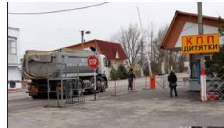
En venant de Kiev, le poste de contrôle à l'entrée de la zone interdite de Tchernobyl, à 30 km de la centrale.